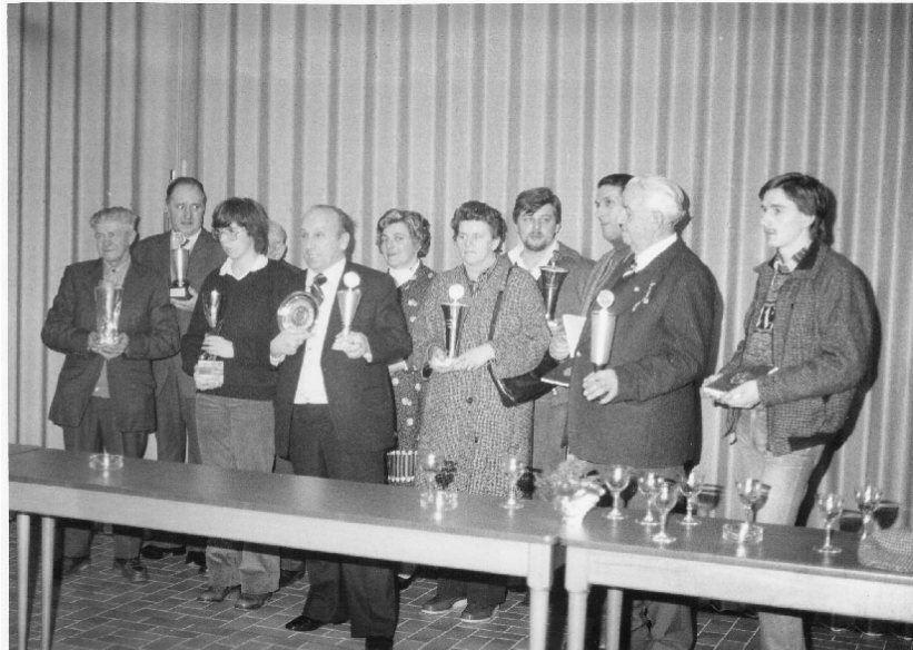
Eröffnungsfeier der Regionalausstellung Nord 1980 in Redingen